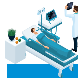
Blinddarm OP 5 Tage im Krankenhaus

Im Ernstfall wollen Sie nicht einfach in irgendein Krankenhaus, sondern in das beste. Als gesetzlich Versicherter haben Sie hier jedoch kaum eine Wahl. Anders ist das mit Ihrer eigenen Zusatzversicherung fürs Krankenhaus. Damit wählen Sie die für sich beste Klinik aus.