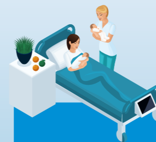
Entbindung 5 Tage im Krankenhaus